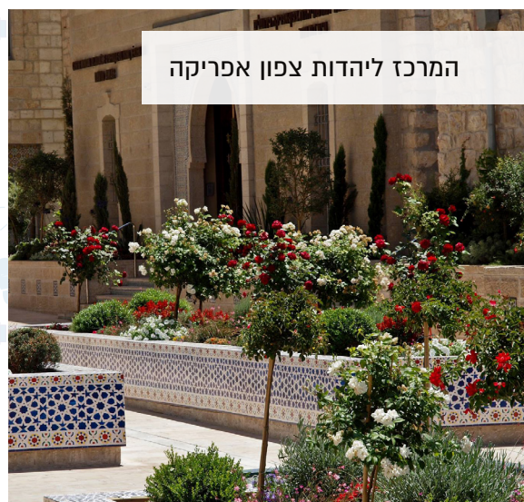
המרכז ליהדות צפון אפריקה

החצר הזו היא מרכזת של שכונת 'מחנה ישראל', השכונה היהודית השנייה מחוץ לחומת העיר העתיקה. השכונה הוקמה על ידי קבוצת יהודים יוצאי צפון אפריקה. במרכז השכונה שוקם בניין בסגנון אנדלוסי. המבנה משלב עבודות קרמיקה מעשה ידי אמנים ממרוקו, ומתקיים שם מרכז למורשת יהדות צפון אפריקה.