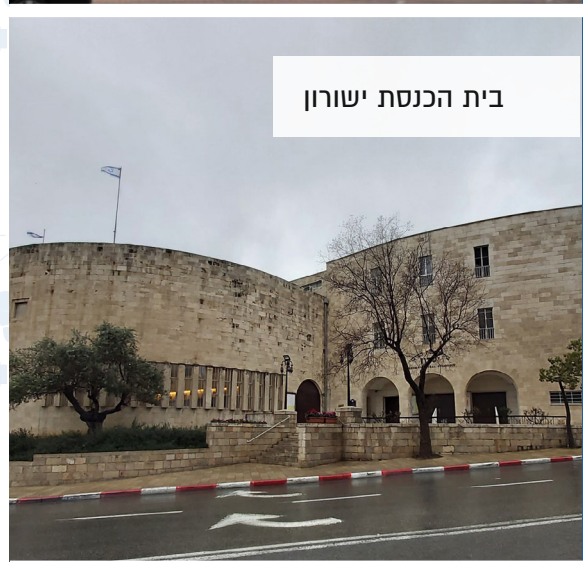
בית הכנסת ישורון

בית הכנסת המודרני הראשון שהוקם בירושלים אליו הגיעו מנהיגי היישוב והמדינה לדג' ישעיהו ליבוביץ. את ספר התורה ראשון של בית הכנסת תרם הרב קוק. סגנון המבנה הוא בין-לאומי כפי שהיה מקובל בשכונת רחביה של אותם הימים, עם חזית קמורה וחלונות אנכיים צרים וארוכים.