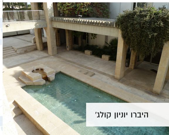
היברו יוניון קולג'

הגענו לתחנה האחרונה בסיור, היברו יוניון קולג' - המכון למדעי היהדות. בקמפוס הזה לומדים תלמידי הרבנות אמריקאים וישראלים יש בקמפוס ספרייה גדולה והוא נחשב לאחד משכיות החמדה של ירושלים ומומלץ לבקר בו ולהתרשם מן הבניינים, החצרות והגנים.