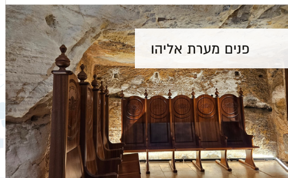
פנים מערת אליהו