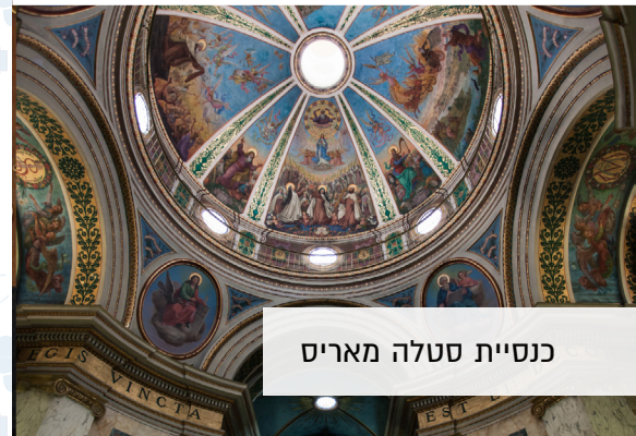
כנסיית סטלה מאריס

לתיאום ביקור ו/או בית מדרש בנושא שלום ובין דתיות לחצו כאן!