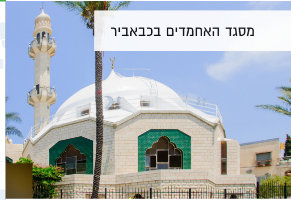
מסגד האחמדים בכבאביר